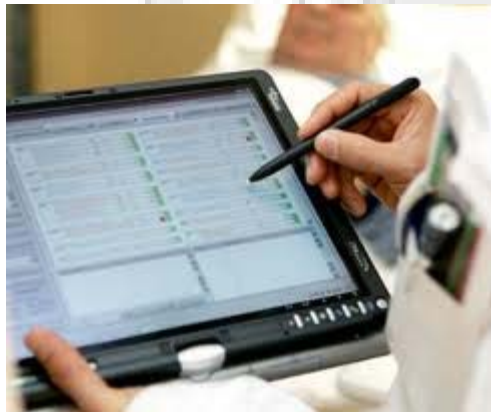
Clinical decision making