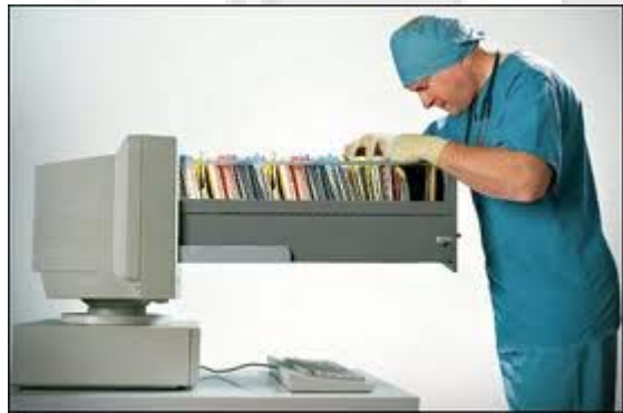
Storing, managing and Transmission of data