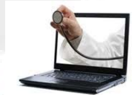
Caring from a distance